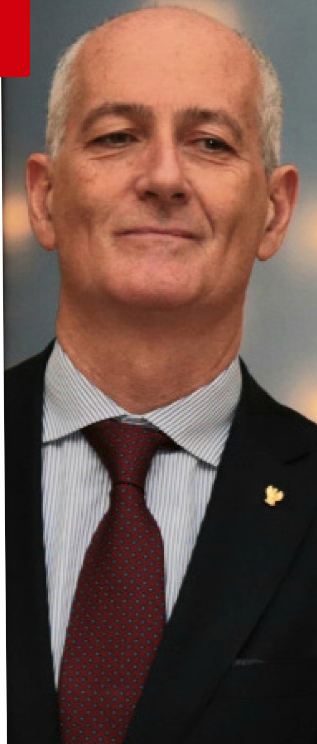
Il Segretario Generale

Per quel che concerne infine l'indennità di ORDINE PUBBLICO , è stato riferito che, con ordinanza del Questore, verrà corrisposta in quei territori ove è stato predisposto il "coprifuoco" notturno nella fascia oraria corrispondente e che si amplierà man mano che altri territori saranno sottoposti a lockdown.